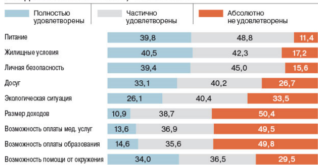
УДОВЛЕТВОРЕННОСТЬ РАЗЛИЧНЫМИ СТОРОНАМИ ЖИЗНИ (МАРТ 2019 ГОДА, % ОТ ДАВШИХ ЗНАЧИМЫЙ ОТВЕТ)

Социологические оценки экономического самочувствия граждан стали особенно ценны после отказа Росстата публиковать ежемесячную статистику о доходах и расходах домохозяйств из-за низкой достоверности (см. “Ъ” от 20 марта). Отдельный интерес представляет опубликованный вчера мониторинг социально-экономического положения и самочувствия населения РАНХиГС, в котором дана его расширенная оценка. Оценки РАНХиГС восприятия личных доходов и экономики схожи с данными Росстата и ЦБ.